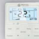
ХК-04 В КОМПЛЕКТЕ