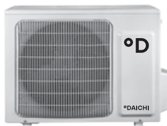
Наружный блок DF25AVS1