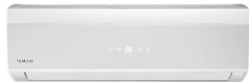
Внутренний блок DA25AVQS1-W