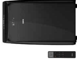
MASSIMO SOLAR BLACK