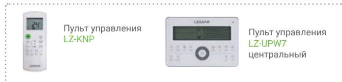
Пульт управления LZ-KNP

Описание систем управления – на стр. 124–128.