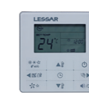
Пульт управления LZ-HJPW проводной