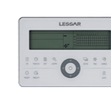
Пульт управления LZ-UPW7 центральный

Инверторные кассетные внутренние блоки предназначены для монтажа в помещениях с подвесными потолками и имеют управляемые жалюзи, обеспечивающие оптимально комфортное воздухо-распределение. Возможность раздачи воздуха по семи направлениям великолепно подходит для использования в помещениях общественного назначения. Максимальный комфорт обеспечивается при установке кассетного блока в центре помещения.