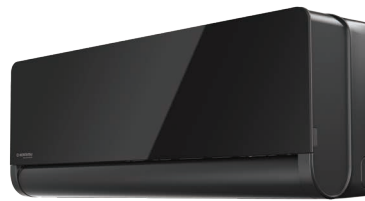
Внутренний блок KSGOM35HZRN1