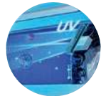
УФ лампа (LED)