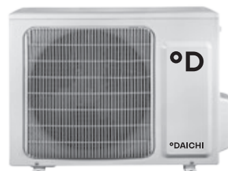
Наружный блок DF25AVS1-L