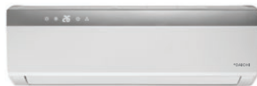
Внутренний блок DA25AVQS1-SL