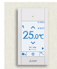
HVGA полноцветный жк-экран размером 3,5 дюйма