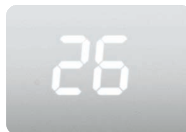
Скрытый дисплей передней панели