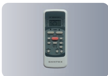
Функциональный пульт ДУ R51

Проводной пульт управления + кабель 17401204A00032 (опция)