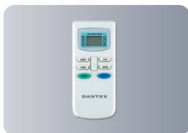
Функциональный пульт ДУ 05E